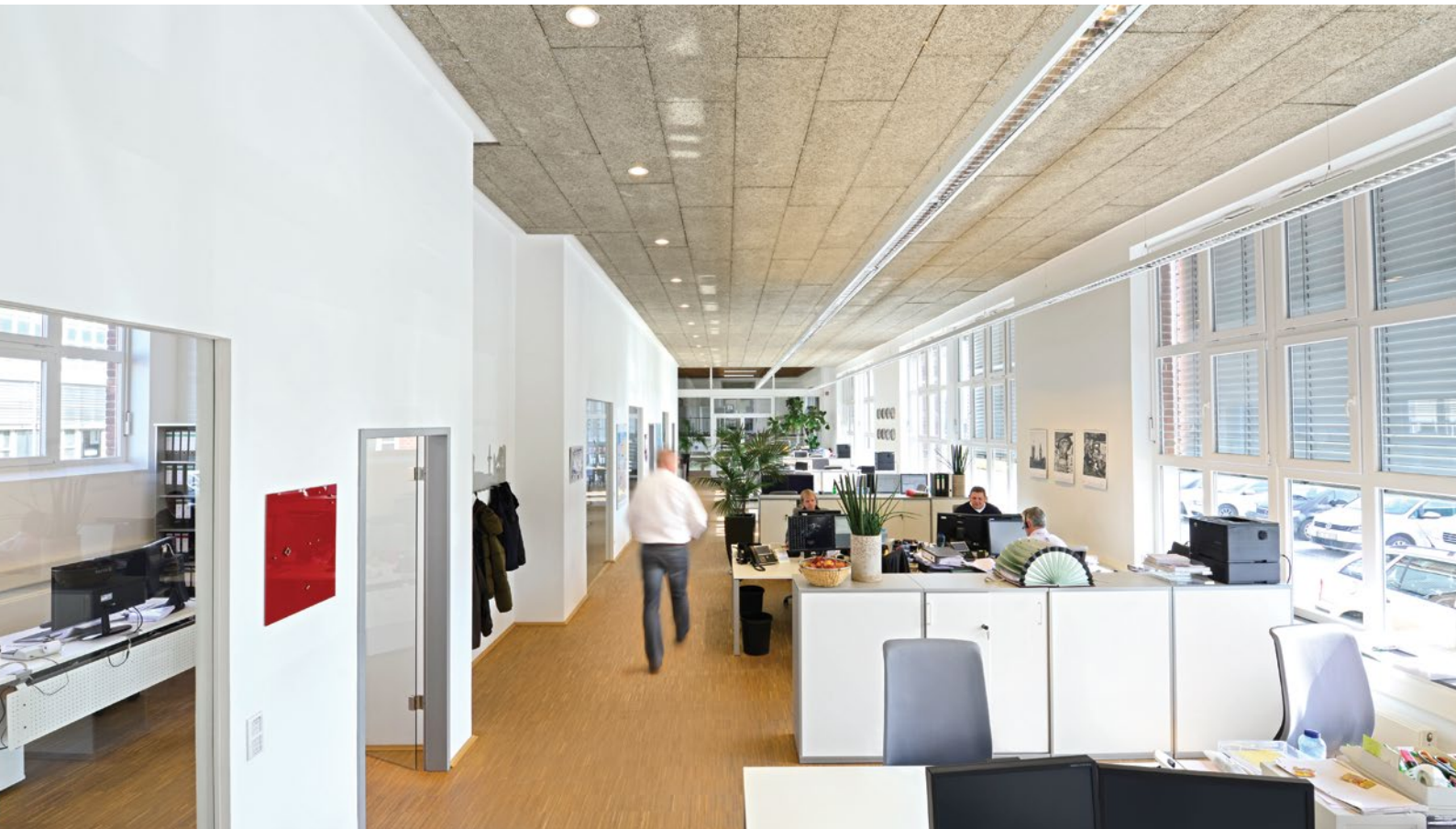
Rein Medical GmbH in Mönchengladbach